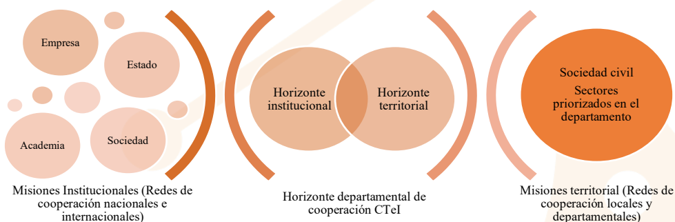
Ilustración 31 Modelo lógico y conceptual de la alternativa de solución

La presente alternativa es basada Programa de inversión en investigación e innovación de la Unión Europea “Horizonte Europa”, por lo tanto, se deben tener presentes los siguientes conceptos: