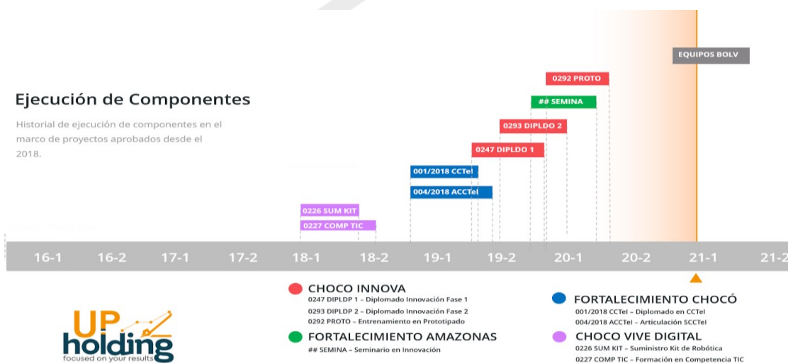
Ilustración 2. Ejecución de componentes

Línea 3 – Ejecución de componentes: Dentro de esta línea se ejecutan actividades de los proyectos aprobados en la línea de formulación de proyectos, teniendo más de 6.130 millones de pesos en contrataciones con diferentes entidades a nivel nacional; se han ejecutado contratos de suministro de equipos, procesos de formación en innovación, proyectos, formulación y gestión de conocimiento y asesorías especializadas. (UP HOLDING SAS - DP, 2021) algunos de estos contratos se muestran a continuación: