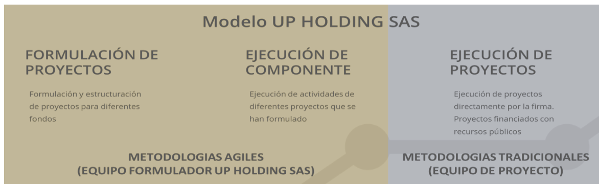
Ilustración 1. Modelo Up Holding SAS

UP HOLDING SAS define tres líneas de negocio que ha venido desarrollando durante los 7 años, estas líneas se presentan a continuación: