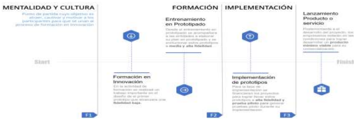
Ilustración 42. línea de tiempo de evolución de los prototipos

La alternativa de solución propone un ejercicio desde la ideación hasta la implementación de un proyecto de innovación que contribuya a los objetivos estratégicos o tenga una contribución directa al mejoramiento de su productividad, esto enfocado en el desarrollo de la competitividad del sector productivo en los Departamentos. Esta alternativa de solución no llegará a la TRL 9 de los prototipos, pero se acompañará a las unidades productivas a buscar otras fuentes de financiación y/o mecanismos para la implementación o fabricación en masa de este nuevo o mejorado proceso, producto o servicio. Por esto se presenta la línea de tiempo que ayuda a entender la evolución de los prototipos y la contribución de cada fase a el crecimiento de los procesos de innovación.