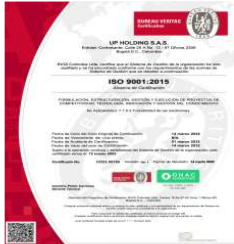
Ilustración 6. Certificación ISO 9001:2000

Igualmente, UP HOLDING S.A.S., por su amplio portafolio, sus alianzas estratégicas globales, sus recursos tecnológicos, su experiencia en diferentes tipos de proyectos y principalmente su Recurso Humano, es uno de los proveedores del mercado que potencialmente puede ofrecer una cobertura total en la formación de innovación empresarial y talleres de prototipado; cumpliendo con la experiencia demandada por el proyecto para este tipo de actividades.