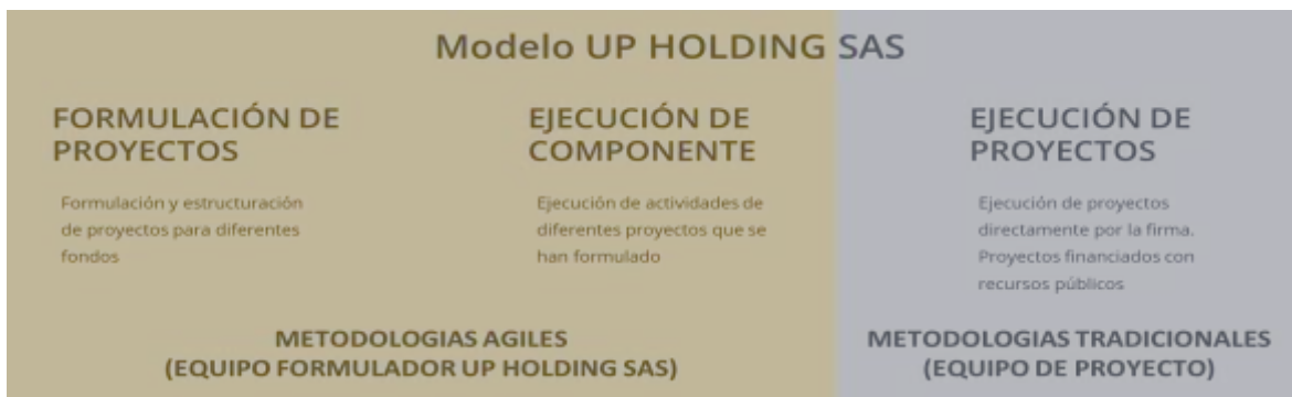
Ilustración 1. Modelo Up Holding SAS

UP HOLDING SAS define tres líneas de negocio que ha venido desarrollando durante los 7 años, estas líneas se presentan a continuación: