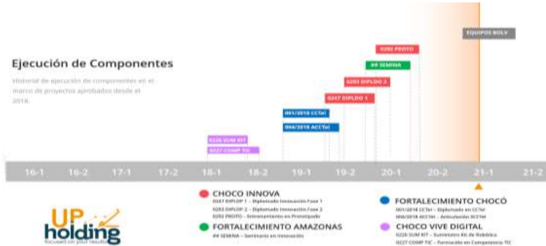
Ilustración 2. Ejecución de componentes

En conclusión, UP HOLDING S.A.S., por su amplio portafolio, sus alianzas estratégicas, sus recursos tecnológicos, su experiencia en diferentes tipos de proyectos y principalmente su Recurso Humano altamente calificado, es uno de los proveedores del mercado que ofrece una cobertura total a la demanda de productos y servicios de innovación, convirtiéndola en uno de los más importantes factores de Integración y desarrollo de proyectos de Ciencia, tecnología e Innovación (CTel).