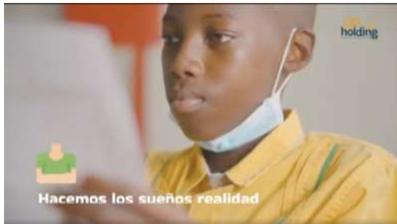
Ilustración 5. Quién es Up Holding SAS (Video)

UP HOLDING S.A.S., es reconocida por ser una de las empresas privadas ejecutoras de proyectos de Ciencia, Tecnología e Innovación con recursos del Sistema General de Regalías (SGR), debido en gran parte a la dinámica interacción que ha tenido con los diferentes aliados estratégicos (Cámara de Comercio, Parquesoft, Gobernaciones, Universidades y Alcaldías) en los 13 departamentos de Colombia donde se han ejecutado este tipo de proyectos de inversión.