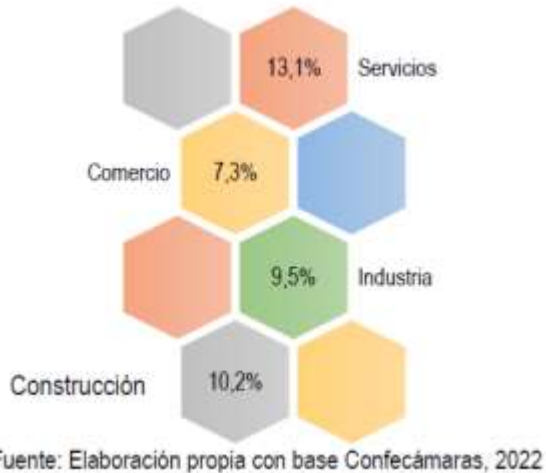
Tabla 3. Relación número de empresas por departamento