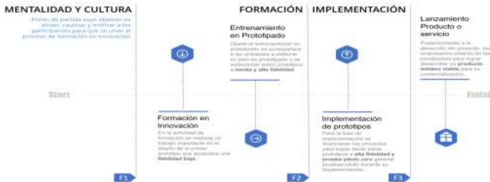
Ilustración 1. línea de tiempo de evolución de los prototipos

Por lo tanto, esta alternativa de solución propone un ejercicio desde la ideación hasta la implementación de un proyecto de innovación que contribuya a los objetivos estratégicos o tenga una contribución directa al mejoramiento de su productividad, esto enfocado en el desarrollo de la competitividad del sector productivo en el Departamento. Esta alternativa de solución no llegará a la TRL 9 de los prototipos, pero se acompañará a las unidades productivas a buscar otras fuentes de financiación y/o mecanismos para la implementación o fabricación en masa de este nuevo o mejorado proceso, producto o servicio. Por esto se presenta la línea de tiempo que ayuda a entender la evolución de los prototipos y la contribución de cada fase a el crecimiento de los procesos de innovación.