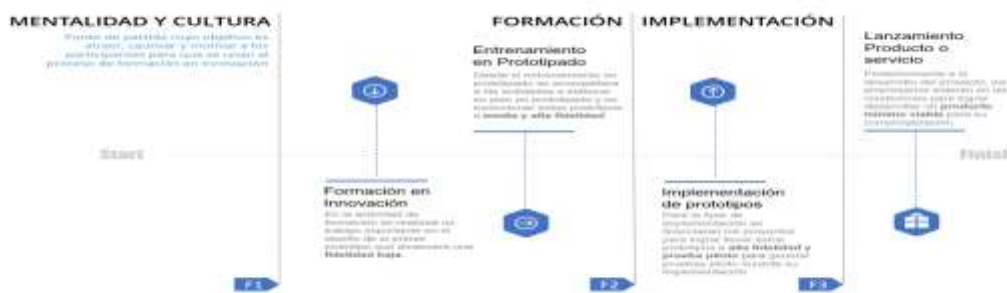
Ilustración 1. línea de tiempo de evolución de los prototipos

Por lo tanto, esta alternativa de solución propone un ejercicio desde la ideación hasta la implementación de un proyecto de innovación que contribuya a los objetivos estratégicos o tenga una contribución directa al mejoramiento de su productividad, esto enfocado en el desarrollo de la competitividad del sector productivo en el Departamento. Esta alternativa de solución no llegará a la TRL 9 de los prototipos, pero se acompañará a las unidades productivas a buscar otras fuentes de financiación y/o mecanismos para la implementación o fabricación en masa de este nuevo o mejorado proceso, producto o servicio. Por esto se presenta la línea de tiempo que ayuda a entender la evolución de los prototipos y la contribución de cada fase a el crecimiento de los procesos de innovación.