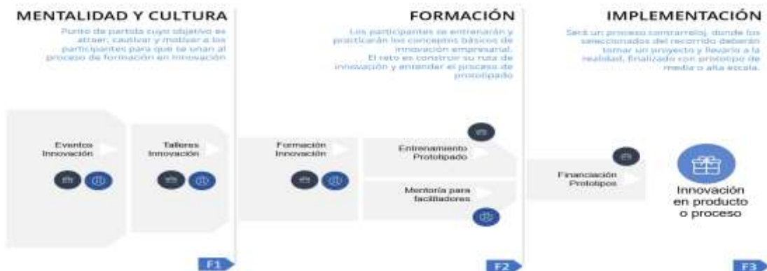
Ilustración Ciclo de vida metodología “Desarrollo de capacidades de la innovación para el desarrollo productivo”

Frente al desarrollo metodológico de las actividades que enmarcan la alternativa de solución definida como “Desarrollo de capacidades en gestión de la innovación para el desarrollo productivo”, se presenta la siguiente ilustración que detalla el proceso metodológico y conceptual e la Alternativa de solución: