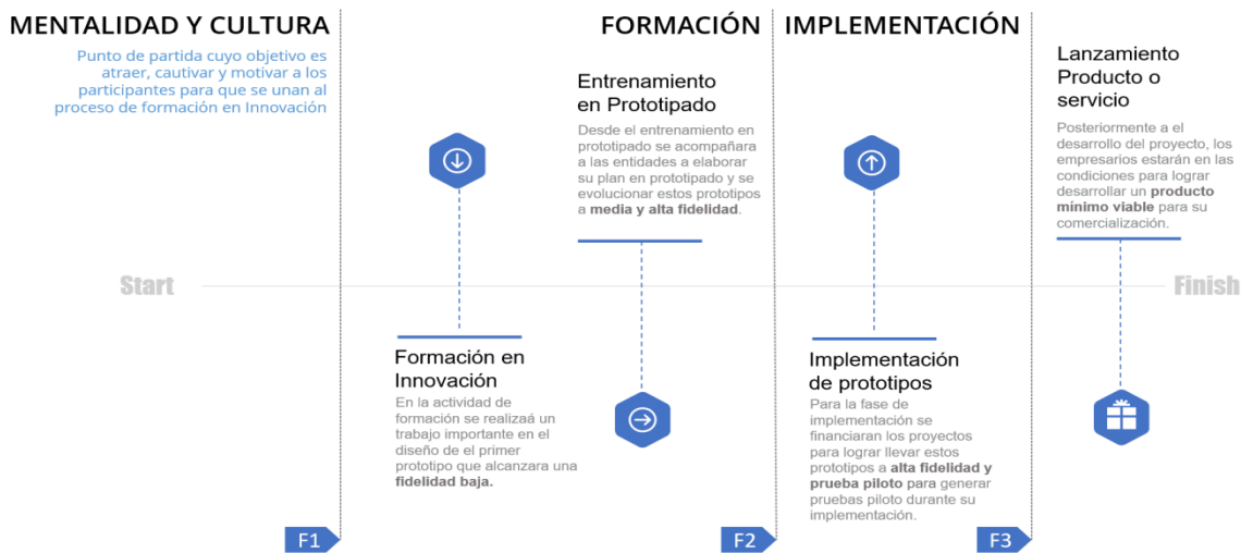
Ilustración 42. línea de tiempo de evolución de los prototipos

La alternativa de solución propone un ejercicio desde la ideación hasta la implementación de un proyecto de innovación que contribuya a los objetivos estratégicos o tenga una contribución directa al mejoramiento de su productividad, esto enfocado en el desarrollo de la competitividad del sector productivo en los Departamentos. Esta alternativa de solución no llegará a la TRL 9 de los prototipos, pero se acompañará a las unidades productivas a buscar otras fuentes de financiación y/o mecanismos para la implementación o fabricación en masa de este nuevo o mejorado proceso, producto o servicio. Por esto se presenta la línea de tiempo que ayuda a entender la evolución de los prototipos y la contribución de cada fase a el crecimiento de los procesos de innovación.