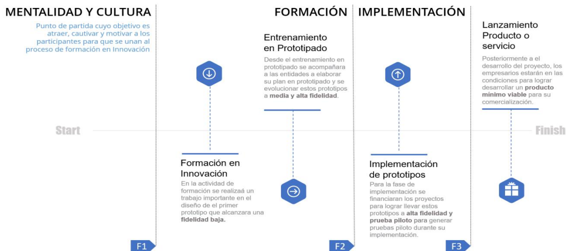
Ilustración 42. línea de tiempo de evolución de los prototipos

La alternativa de solución propone un ejercicio desde la ideación hasta la implementación de un proyecto de innovación que contribuya a los objetivos estratégicos o tenga una contribución directa al mejoramiento de su productividad, esto enfocado en el desarrollo de la competitividad del sector productivo en los Departamentos. Esta alternativa de solución no llegará a la TRL 9 de los prototipos, pero se acompañará a las unidades productivas a buscar otras fuentes de financiación y/o mecanismos para la implementación o fabricación en masa de este nuevo o mejorado proceso, producto o servicio. Por esto se presenta la línea de tiempo que ayuda a entender la evolución de los prototipos y la contribución de cada fase a el crecimiento de los procesos de innovación.