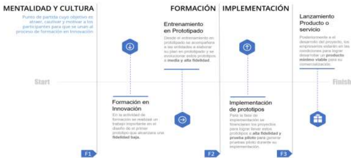
Ilustración 42. línea de tiempo de evolución de los prototipos

La alternativa de solución propone un ejercicio desde la ideación hasta la implementación de un proyecto de innovación que contribuya a los objetivos estratégicos o tenga una contribución directa al mejoramiento de su productividad, esto enfocado en el desarrollo de la competitividad del sector productivo en los Departamentos. Esta alternativa de solución no llegará a la TRL 9 de los prototipos, pero se acompañará a las unidades productivas a buscar otras fuentes de financiación y/o mecanismos para la implementación o fabricación en masa de este nuevo o mejorado proceso, producto o servicio. Por esto se presenta la línea de tiempo que ayuda a entender la evolución de los prototipos y la contribución de cada fase a el crecimiento de los procesos de innovación.