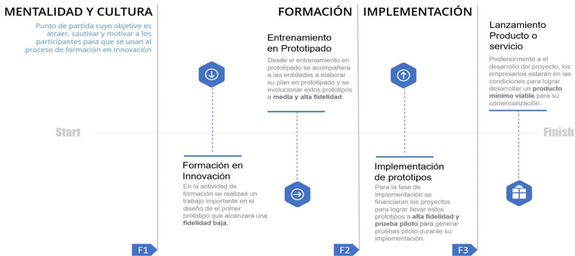
Ilustración 42. línea de tiempo de evolución de los prototipos

La alternativa de solución propone un ejercicio desde la ideación hasta la implementación de un proyecto de innovación que contribuya a los objetivos estratégicos o tenga una contribución directa al mejoramiento de su productividad, esto enfocado en el desarrollo de la competitividad del sector productivo en los Departamentos. Esta alternativa de solución no llegará a la TRL 9 de los prototipos, pero se acompañará a las unidades productivas a buscar otras fuentes de financiación y/o mecanismos para la implementación o fabricación en masa de este nuevo o mejorado proceso, producto o servicio. Por esto se presenta la línea de tiempo que ayuda a entender la evolución de los prototipos y la contribución de cada fase a el crecimiento de los procesos de innovación.