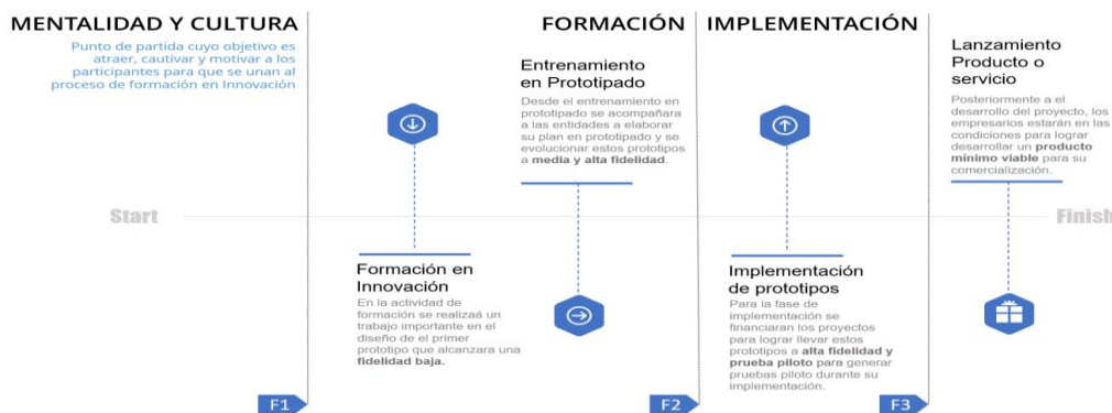
Ilustración 1. línea de tiempo de evolución de los prototipos

Por lo tanto, esta alternativa de solución propone un ejercicio desde la ideación hasta la implementación de un proyecto de innovación que contribuya a los objetivos estratégicos o tenga una contribución directa al mejoramiento de su productividad, esto enfocado en el desarrollo de la competitividad del sector productivo en el Departamento. Esta alternativa de solución no llegará a la TRL 9 de los prototipos, pero se acompañará a las unidades productivas a buscar otras fuentes de financiación y/o mecanismos para la implementación o fabricación en masa de este nuevo o mejorado proceso, producto o servicio. Por esto se presenta la línea de tiempo que ayuda a entender la evolución de los prototipos y la contribución de cada fase a el crecimiento de los procesos de innovación.