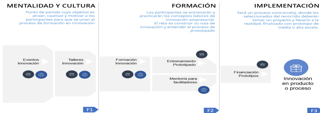
Ilustración Ciclo de vida metodología “Desarrollo de capacidades de la innovación para el desarrollo productivo”

Frente al desarrollo metodológico de las actividades que enmarcan la alternativa de solución definida como “Desarrollo de capacidades en gestión de la innovación para el desarrollo productivo”, se presenta la siguiente ilustración que detalla el proceso metodológico y conceptual e la Alternativa de solución: