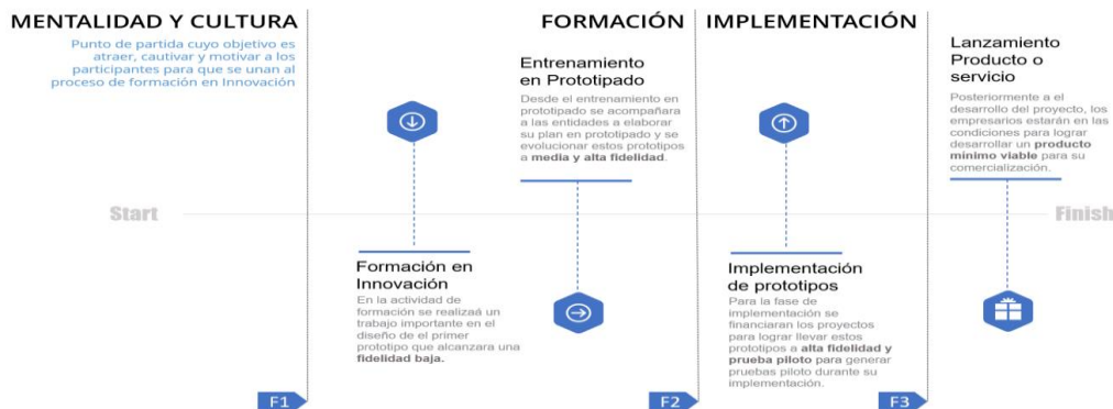
Ilustración 1. línea de tiempo de evolución de los prototipos

Por lo tanto, esta alternativa de solución propone un ejercicio desde la ideación hasta la implementación de un proyecto de innovación que contribuya a los objetivos estratégicos o tenga una contribución directa al mejoramiento de su productividad, esto enfocado en el desarrollo de la competitividad del sector productivo en el Departamento. Esta alternativa de solución no llegará a la TRL 9 de los prototipos, pero se acompañará a las unidades productivas a buscar otras fuentes de financiación y/o mecanismos para la implementación o fabricación en masa de este nuevo o mejorado proceso, producto o servicio. Por esto se presenta la línea de tiempo que ayuda a entender la evolución de los prototipos y la contribución de cada fase a el crecimiento de los procesos de innovación.