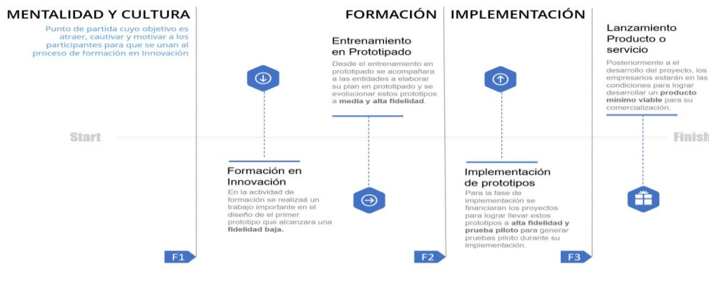
Ilustración 1. línea de tiempo de evolución de los prototipos

Por lo tanto, esta alternativa de solución propone un ejercicio desde la ideación hasta la implementación de un proyecto de innovación que contribuya a los objetivos estratégicos o tenga una contribución directa al mejoramiento de su productividad, esto enfocado en el desarrollo de la competitividad del sector productivo en el Departamento. Esta alternativa de solución no llegará a la TRL 9 de los prototipos, pero se acompañará a las unidades productivas a buscar otras fuentes de financiación y/o mecanismos para la implementación o fabricación en masa de este nuevo o mejorado proceso, producto o servicio. Por esto se presenta la línea de tiempo que ayuda a entender la evolución de los prototipos y la contribución de cada fase a el crecimiento de los procesos de innovación.