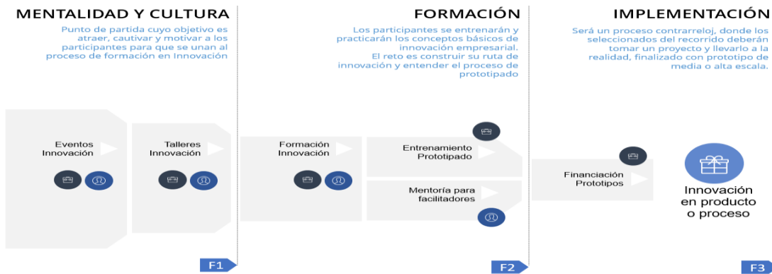
Ilustración Ciclo de vida metodología “Desarrollo de capacidades de la innovación para el desarrollo productivo”

Frente al desarrollo metodológico de las actividades que enmarcan la alternativa de solución definida como “Desarrollo de capacidades en gestión de la innovación para el desarrollo productivo”, se presenta la siguiente ilustración que detalla el proceso metodológico y conceptual e la Alternativa de solución: