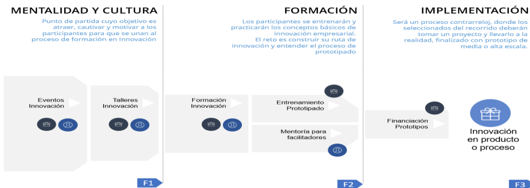
Ilustración Ciclo de vida metodología “Desarrollo de capacidades de la innovación para el desarrollo productivo”

Frente al desarrollo metodológico de las actividades que enmarcan la alternativa de solución definida como “Desarrollo de capacidades en gestión de la innovación para el desarrollo productivo”, se presenta la siguiente ilustración que detalla el proceso metodológico y conceptual e la Alternativa de solución: