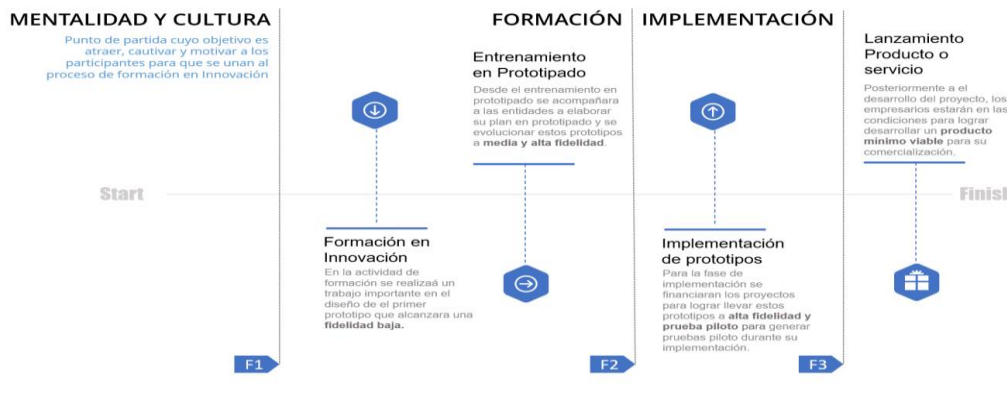
Ilustración 1. línea de tiempo de evolución de los prototipos

Por lo tanto, esta alternativa de solución propone un ejercicio desde la ideación hasta la implementación de un proyecto de innovación que contribuya a los objetivos estratégicos o tenga una contribución directa al mejoramiento de su productividad, esto enfocado en el desarrollo de la competitividad del sector productivo en el Departamento. Esta alternativa de solución no llegará a la TRL 9 de los prototipos, pero se acompañará a las unidades productivas a buscar otras fuentes de financiación y/o mecanismos para la implementación o fabricación en masa de este nuevo o mejorado proceso, producto o servicio. Por esto se presenta la línea de tiempo que ayuda a entender la evolución de los prototipos y la contribución de cada fase a el crecimiento de los procesos de innovación.