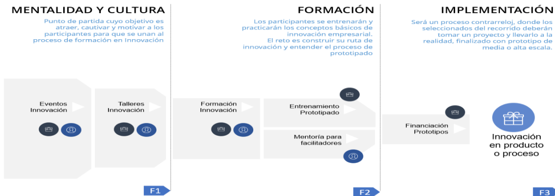
Ilustración Ciclo de vida metodología “Desarrollo de capacidades de la innovación para el desarrollo productivo”

Frente al desarrollo metodológico de las actividades que enmarcan la alternativa de solución definida como “Desarrollo de capacidades en gestión de la innovación para el desarrollo productivo”, se presenta la siguiente ilustración que detalla el proceso metodológico y conceptual e la Alternativa de solución: