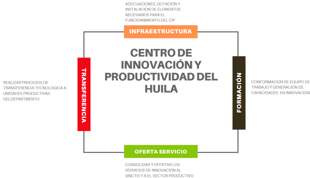
Ilustración 1 Esquema de alternativa de solución

Dentro del componente de infraestructura se tendrá en cuenta todos los procesos relacionados con las actividades de adecuación, dotación, instalación y puesta en marcha de los espacios diseñados dentro del centro de innovación para el desarrollo de las actividades de innovación, para este caso se contará con espacios dedicados a la innovación como salón de capacitaciones, espacio de coworking, zonas de ideación, zona de laboratorios y prototipado. Para el caso del componente de formación se realizarán diferentes procesos que ayudarán al personal del centro a capacitarse el funcionamiento técnico, operativo y estratégico del Centro y además, se realizarán procesos de generación de capacidades en innovación a actores del Sistema de innovación, empresarios y/o jóvenes con el fin de desarrollar competencias mínimas para el aprovechamiento del Centro de Innovación.