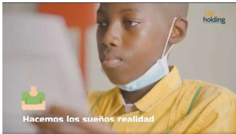
Ilustración 5. Quién es Up Holding SAS (Video)

UP HOLDING S.A.S., es reconocida por ser una de las empresas privadas ejecutoras de proyectos de Ciencia, Tecnología e Innovación con recursos del Sistema General de Regalías (SGR), debido en gran parte a la dinámica interacción que ha tenido con los diferentes aliados estratégicos (Cámara de Comercio, Parquesoft, Gobernaciones, Universidades y Alcaldías) en los 13 departamentos de Colombia donde se han ejecutado este tipo de proyectos de inversión.