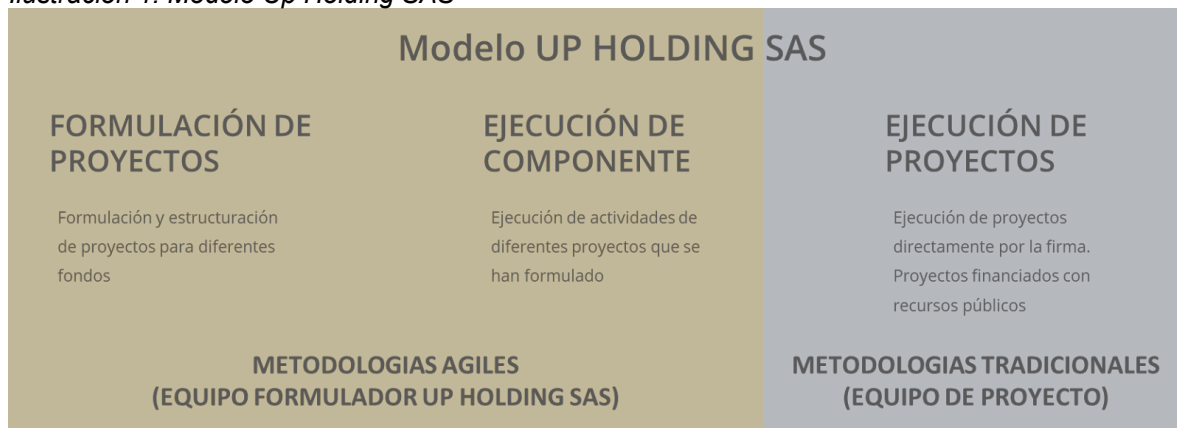
Ilustración 1. Modelo Up Holding SAS

UP HOLDING SAS define tres líneas de negocio que ha venido desarrollando durante los 7 años, estas líneas se presentan a continuación: