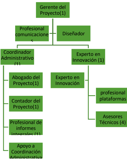
Ilustración 4. Organigrama Proyecto de inversión

Dentro del proyecto se generan 15 empleos por medio de prestación de servicios, así: